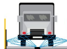
Rys. 5. Myjka do kół