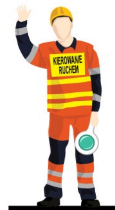
Rys. 4. Kierujący ruchem