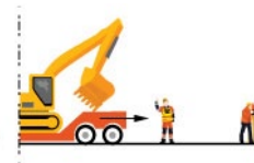
Rys. 3. Kierowanie ruchem pojazdów